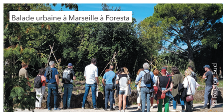
Balade urbaine à Marseille à Foresta

En pratique : l'exposition « Nature en ville et adaptation au changement climatique » est disponible auprès de chaque service environnement des métropoles* ou par mail à nature4citylife@maregionsud.fr