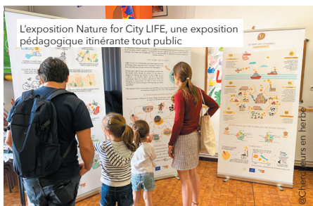
L'exposition Nature for City LIFE, une exposition pédagogique itinérante tout public