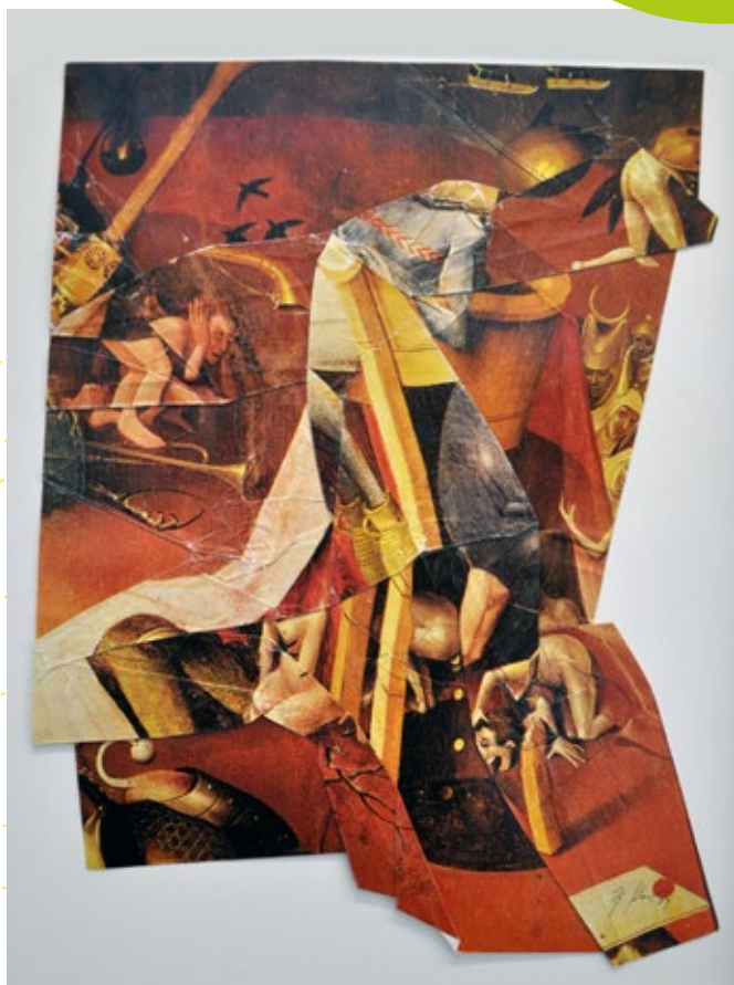
Jiri Kolar : « Les Jardins de délices »

Le Minimag te propose de fabriquer tes propres « images en morceaux » et de laisser libre cours à ton imagination comme le fait l'artiste Jiri Kolar avec son œuvre « Les Jardins de délices » (d'après Jérôme Bosch) exposée à la villa Tamaris.