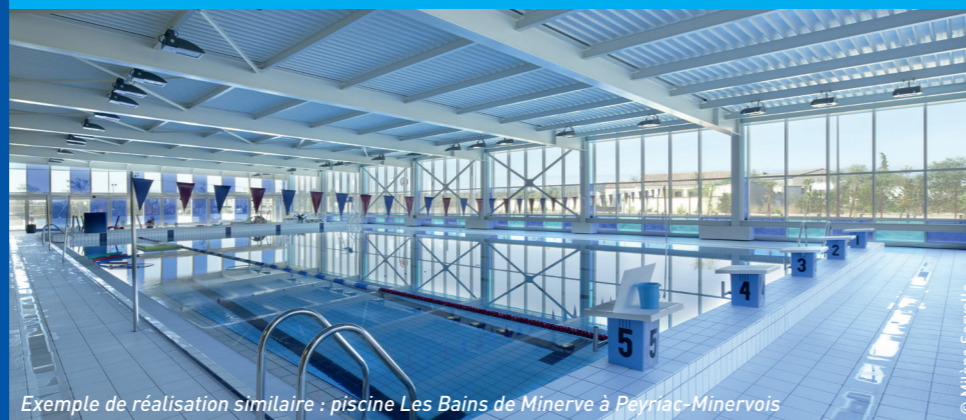
Exemple de réalisation similaire : piscine Les Bains de Minerve à Peyriac-Minervois

En effet, ce projet structurant est basé sur la nécessité de réaliser la mise aux normes des 3 bassins qui va permettre la création d'un complexe aquatique neuf réglementaire et adapter la demande contemporaine en matière aquatique et aux exigences de l'écoresponsabilité. La vocation première sera la natation scolaire sur cette partie du territoire carencée dans ce domaine.