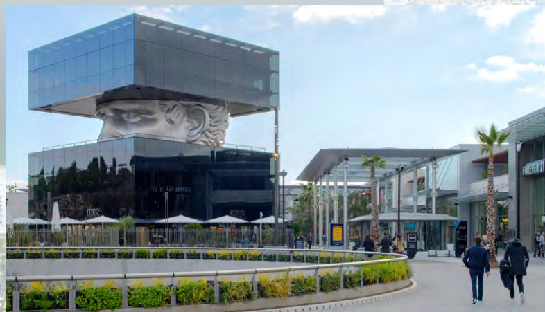
Le Polygone Riviera à Cagnes-sur-Mer (2012-2015)