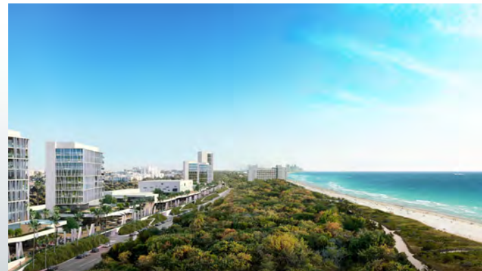
Les West Lots à North Beach en Floride (2018-...)