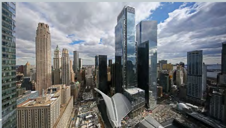
Le 3 World Trade Center à New York (2006-2018)