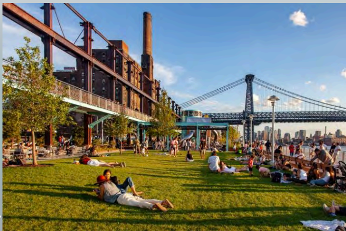
Le Domino Park à New York (2012-2018)