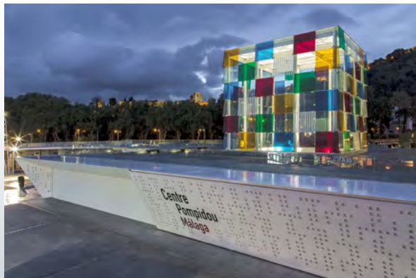
Le Muelle Uno à Malaga en Espagne (2009-2011)