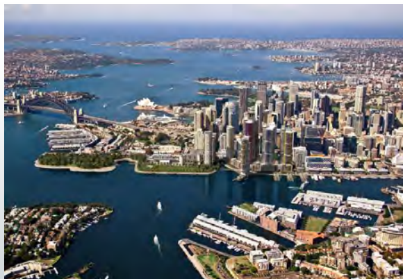
La péninsule de Barangaroo à Sydney en Australie (2009-2015)