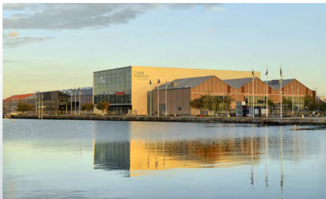
Le centre de congrès et d'exposition Carré des Docks au Havre (2014-2016)