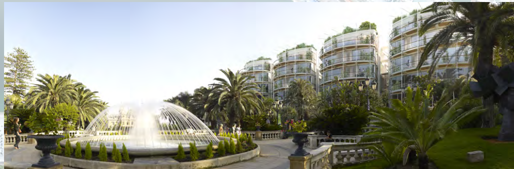
One Monte Carlo à Monaco (2008-...)