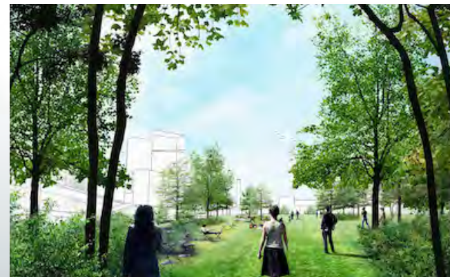
La ZAC Bercy Charenton à Paris (2009-2016)