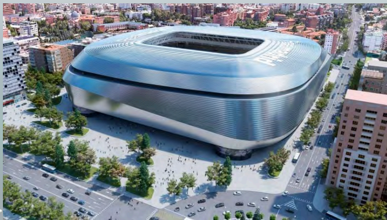
Le Stade Santiago Bernabeu à Madrid (2019-...)