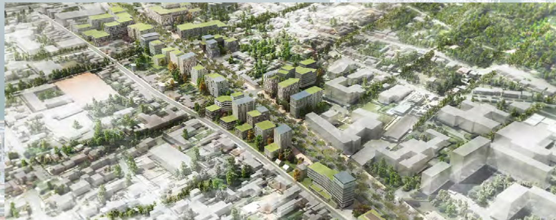
La ZAC Rouget de Lisle du Grand Paris à Vitry-sur-Seine (2014-2019)