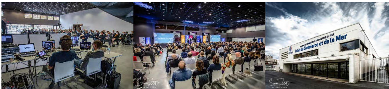
Palais du Commerce et de la Mer