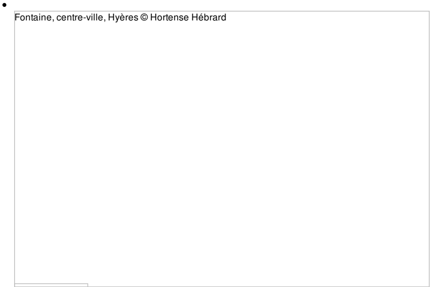
Fontaine, centre-ville, Hyères

Le patrimoine rural a façonné en partie l'image du territoire de Toulon Provence Méditerranée. Valorisé au travers de visites patrimoniales, il contribue à la valeur attractive des villes et villages. Il est important de ne pas perdre l'authenticité de chaque édifice.