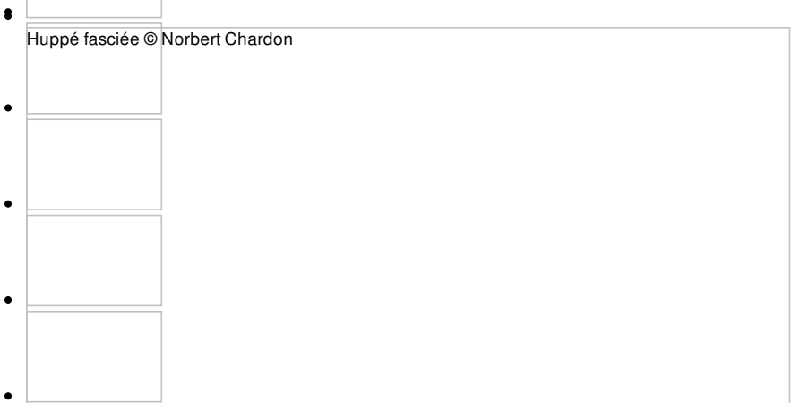
Huppé fasciée

Pour concrétiser leurs objectifs de développement durable et participer à l'effort collectif de préservation des ressources naturelles et de la biodiversité la Métropole TPM, Veolia Territoire Var Provence Méditerranée, et la LPO PACA ont signé une convention de partenariat en 2020, autour du programme Refuge LPO®.